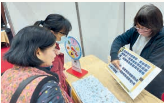
科管局法令宣導，舉行有獎徵答

科管局當天設攤以有獎徵答的方式與民眾互動，進行職場平權與勞基法相關之法令宣導及提供現場諮詢服務；此外，有鑑於各類型詐騙案件層出不窮，宜蘭縣政府警察局也派員在現場進行反詐宣導，提醒民眾若求職關鍵字出現「高薪輕鬆」、「工作時間自由」，或要求先行提供金融帳號等，就應該提高警覺。