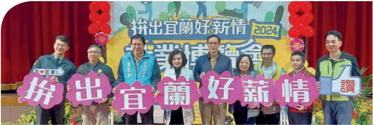
與會貴賓合影：宜蘭縣林姿妙縣長（左4）、科管局胡世民副局長（中）

2024「拚出宜蘭好薪情」就業博覽會，於3月9日在宜蘭運動公園體育館舉辦，共邀集51家廠商共襄盛舉，提供超過1,200個工作機會，其中包含15家銀髮友善廠商釋出共515個職缺。經統計，當天現場投遞履歷共507人次，初步錄取294人，媒合率約57%。