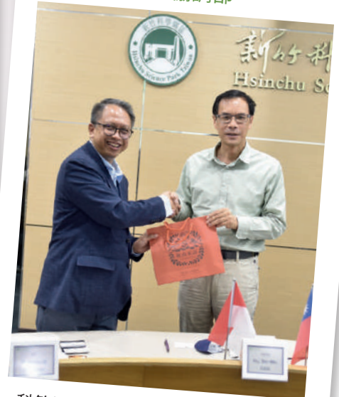
科管局胡世民副局長（右）、印尼經濟協調部Edi P. Pambudi次長（左）