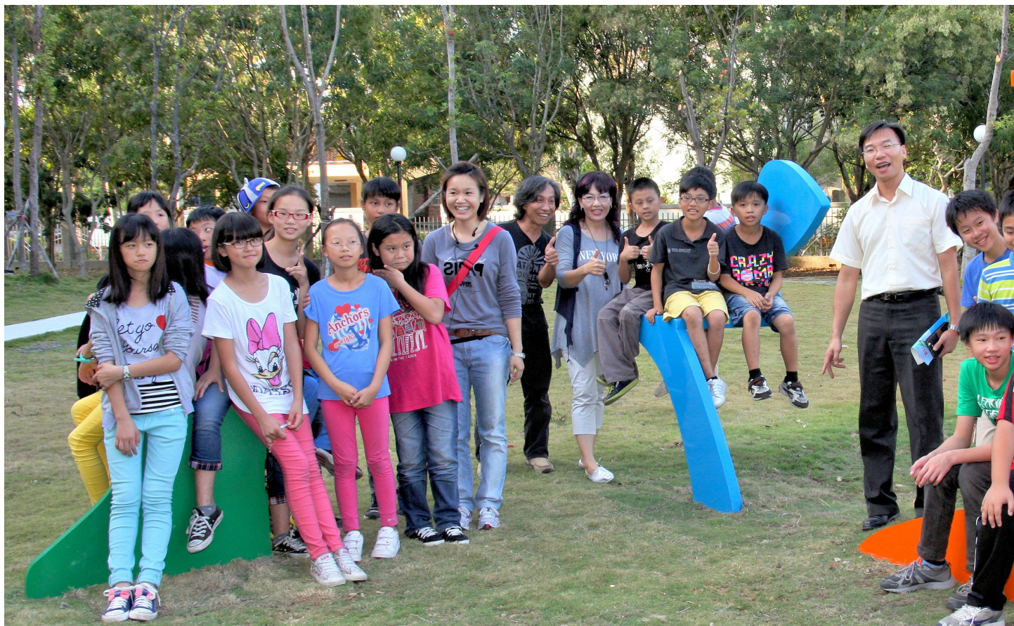
▲頂埔國小師生參與導覽活動