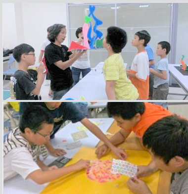
▲頂埔國小學生參與創作演練

《繁衍 · 綻放》屬系列作品，旨在反映竹南園區已形成一多元性之科技園區，並促進竹南地區之產業發展與地方之永續成長。創作者藝術家楊智富延續自身的創作脈絡（風格），深入了解竹南園區發展現況與地方之關連性，以「平行與交叉」、「對話與對比」同時並存的創作思維，構思發展本項作品。